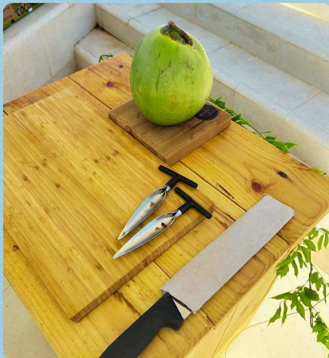
FÁCIL DE PREPARAR