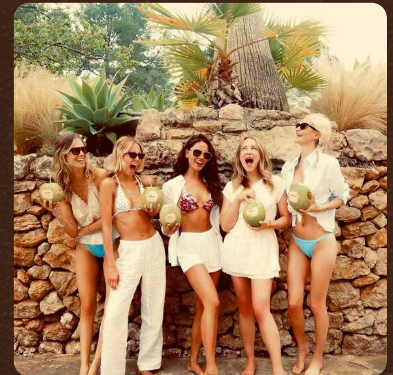
INFLUENCER POPPY DELEVINGNE