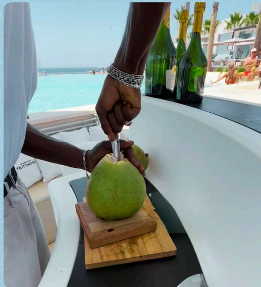
FÁCIL DE ABRIR